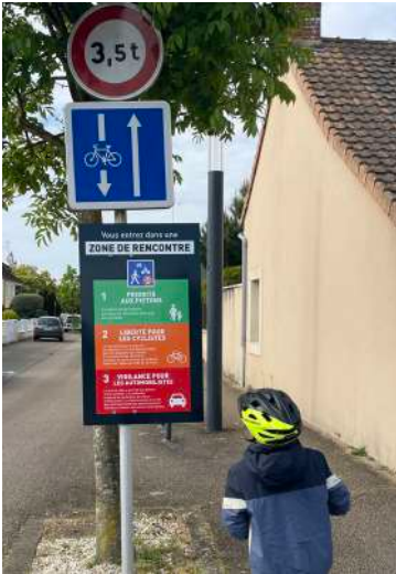
Rue de la Mairie